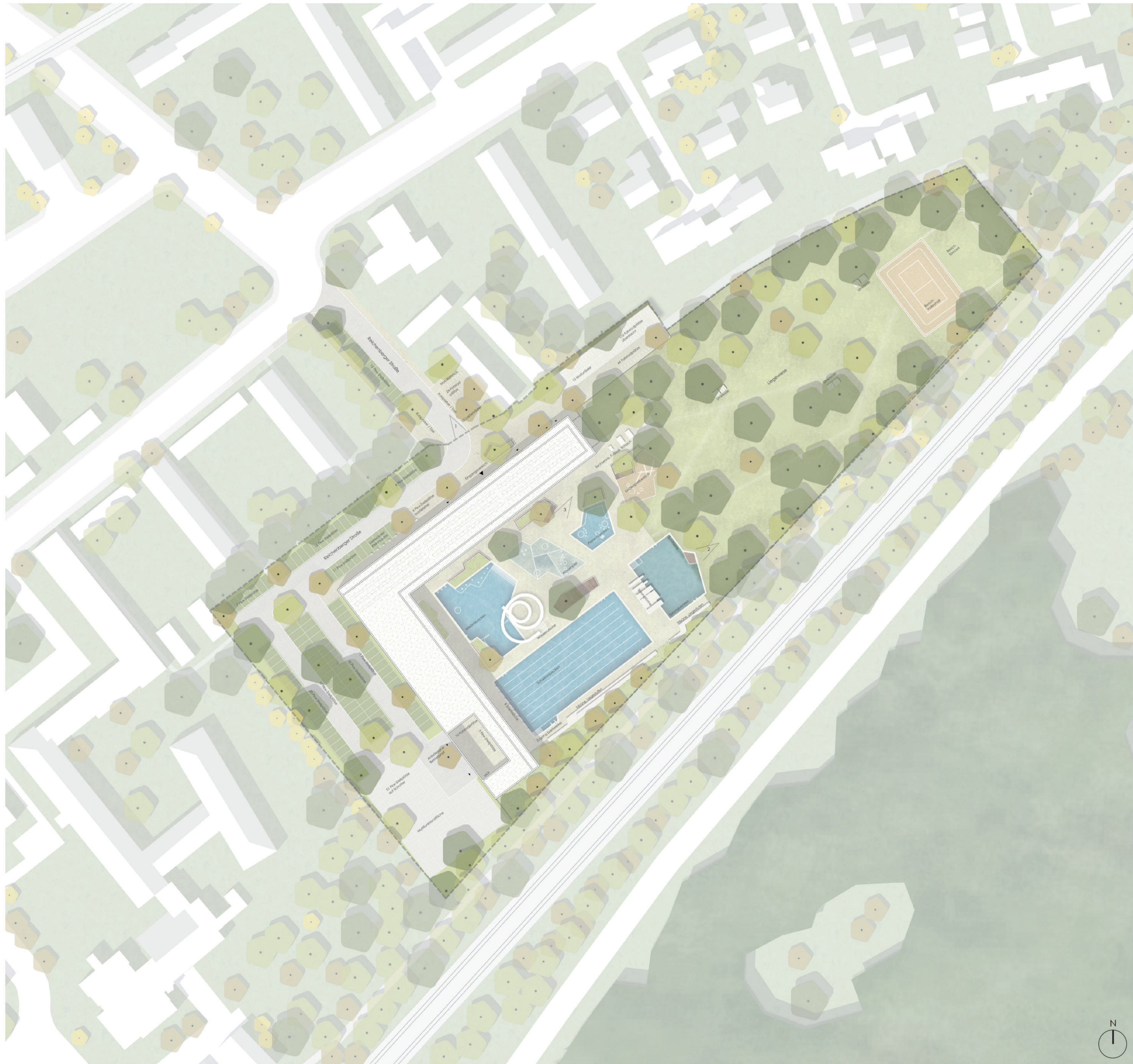
LAGEPLAN M 1: 500