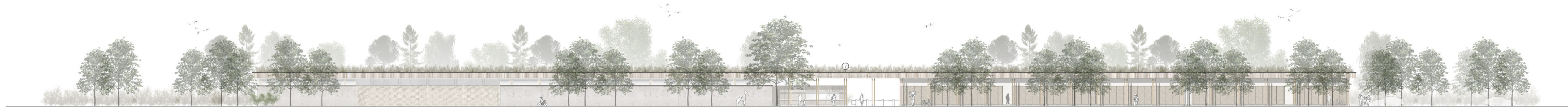
Ansicht Norden - Eingangsbereich M1:200